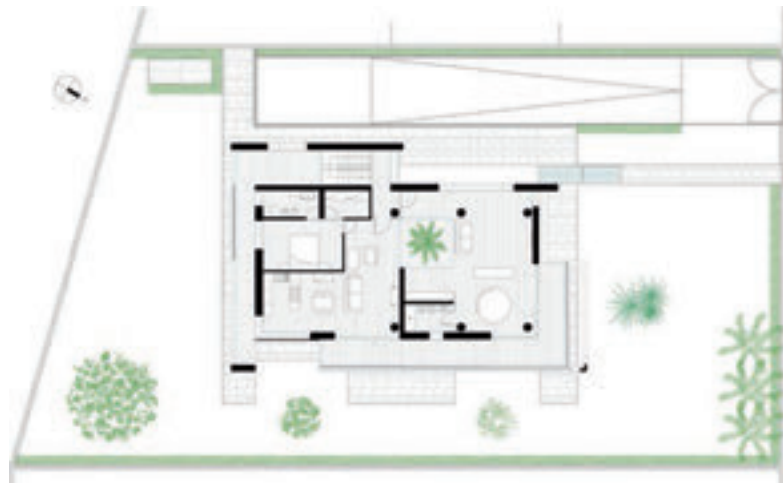
primo piano/first level

Planimetrie dei due livelli che compongono la villa progettata da Architrend Architecture e scorcii degli interni. Al piano terreno, cucina e camera da letto padronale (in alto) danno sul giardino e sono avvolti dal verde. Al primo piano (in basso), gli alloggi riservati ai figli dei committenti sono pensati e suddivisi autonomamente; maggiormente inondati di luce, sono dotati di pannelli frangisole e tende in alluminio per modularne l'intensità.