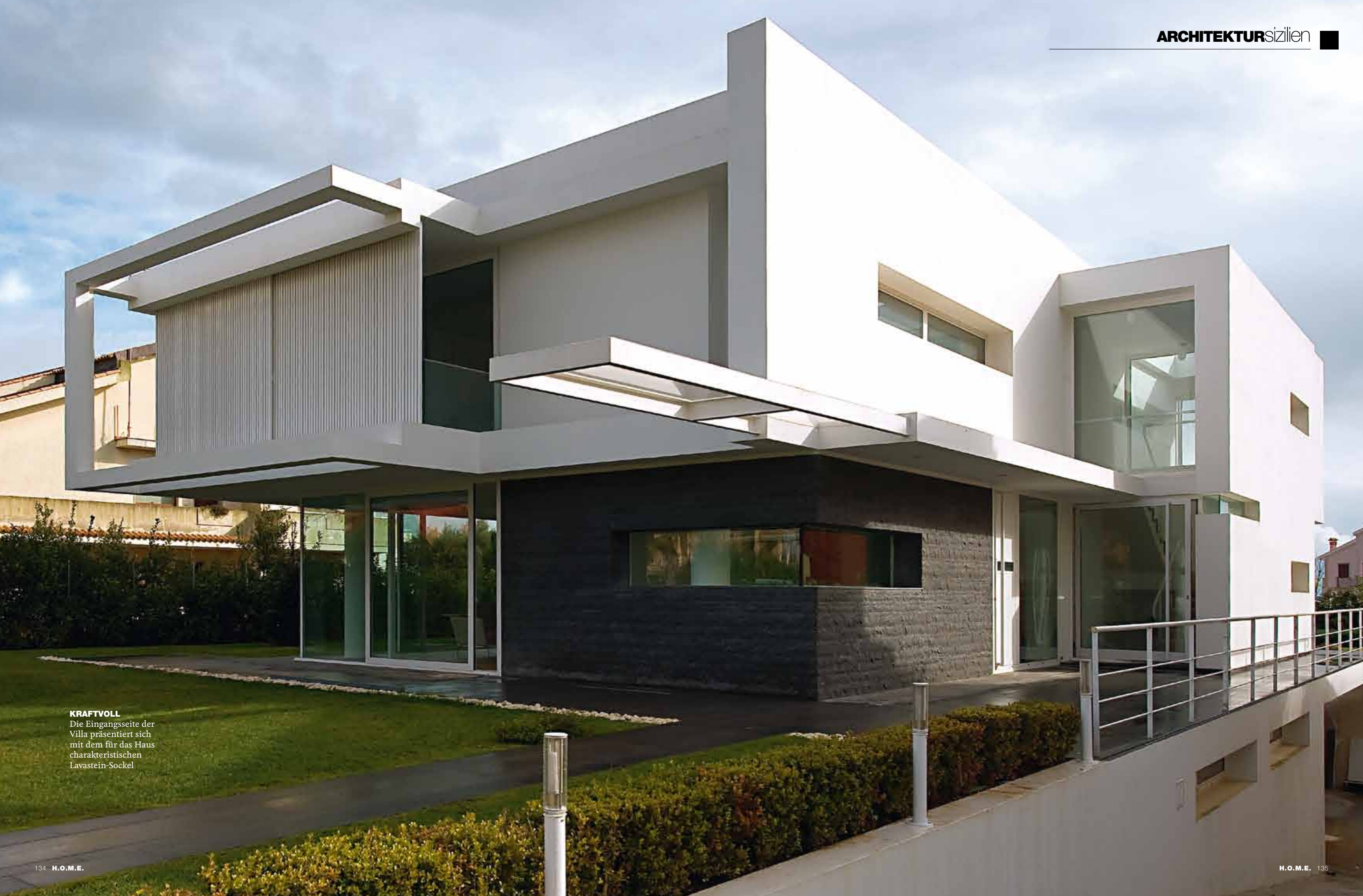
KRAFTVOLL Die Eingangsseite der Villa präsentiert sich mit dem für das Haus charakteristischen Lavastein-Sockel